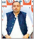
नौकरा मिल रही है। जीद में सड़कों का जाल बन गया है। अब न दिल्ली दूर और न ही चंडीगढ़। किसानों को फसलों पर एमएसपी का लाभ मिल रहा है। किसान, मजदूर, कर्मचारी हर वर्ग भाजपा सरकार से खुश है।

प्रदेश विकास में निरंतर आगे बढ़ रहा है। मंत्रि के आधार पर नौकरा देकर भाजपा सरकार ने इतिहास पूरे देश में बनाने का काम किया है। पहले जो पच्ची व चार पहाले जीद में करोड़ों के विकास कार्यों की सौगात देंगे। जिससे जिले में और तेजी से विकास कार्य होंगे। दोनों स्थानों पर सीएम की रेली को लेकर लोगों में जबरदस्त उत्साह है। सीएम की रेली जिले को नई दिशा देगी। कहा कि विपक्ष के पास कोई मुद्दा नहीं है। सीएम नायब सिंह सैनी की मुस्कान से भी विपक्षी नेताओं के पेट में दर्द होने लग जाता है। आज विपक्ष हाशिये पर जा चुका है। भाजपा सरकार में