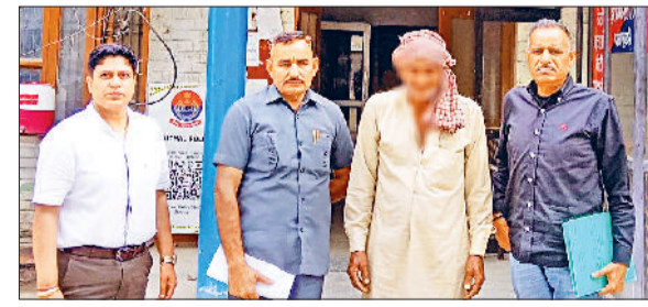
कैथल। बरामद किया गया पीड़ित पुलिस टीम के साथ।

विभाग यह सुनिश्चित करें कि खरीद प्रक्रिया शुरू होने से पूर्व सभी व्यवस्थाएं पूरी तरह दुरुस्त कर ली जाएं। उन्होंने विशेष रूप से निर्देश दिए कि मंडियों में साफ-सफाई की उचित व्यवस्था रहे तथा नालों की समय पर सफाई कराई जाए ताकि किसी प्रकार की जलमयव की स्थिति उत्पन्न न हो। उन्होंने कहा कि प्रत्येक अनाज मंडी और खरीद केंद्र पर सीसीटीवी कैमरे सुचारु रूप से कार्यरत होने चाहिए। जिससे पूरी खरीद प्रक्रिया की निगरानी पारदर्शी तरीके से की जा सके। इसके अतिरिक्त गेट पास प्रणाली और बायोमेट्रिक व्यवस्था को भी प्रभावी ढंग से लागू किया जाए।