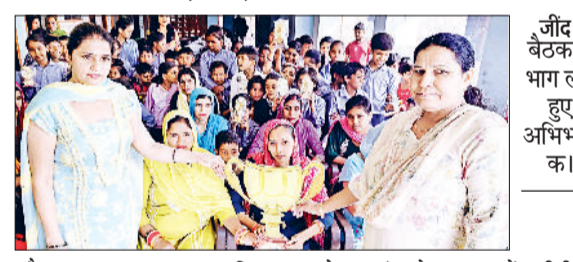
जौड़ में बैठक में भाग लेते हुए अभिभावक।

शिक्षा विभाग के दिशा-निर्देशानुसार बुधवार जिले के सभी 423 प्राथमिक विद्यालयों में एक साथ अभिभावक-शिक्षक बैठक का आयोजन किया गया। इस बैठक का मुख्य उद्देश्य अभिभावकों को बच्चों की शैक्षणिक प्रगति, सीखने की प्रक्रिया और विद्यालय की गतिविधियों से जोड़ना रहा है। जिनमें विद्यार्थियों को और सुधार की आवश्यकता है। यह रिपोर्ट कार्ड पारंपरिक अंकों के बजाय बच्चों की समग्र प्रगति पर आधारित है, जिससे अभिभावक अपने बच्चों की वास्तविक सीखने की स्थिति को