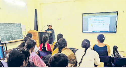
जीद। व्याख्यान को संबोधित करते वक्ता।