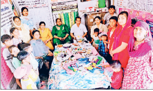
जीद। कार्यक्रम में भाग लेते हुए।