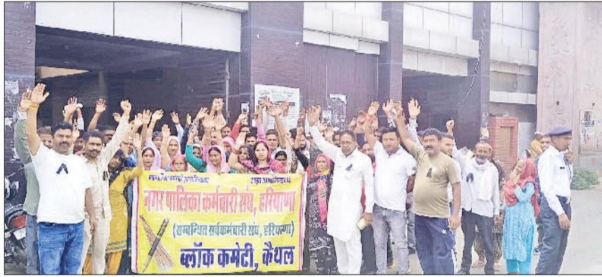
कैथल। नारेबाजी करते कर्मचारी।