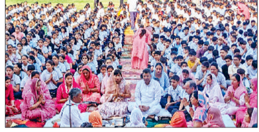
जीद। यज्ञ में आहुति डालते हुए।