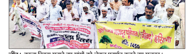
जौड़। काला दिवस मनाते हुए मांगों को लेकर प्रदर्शन करते हुए मजदूर।