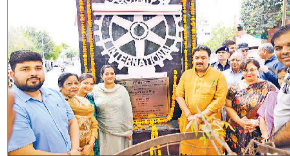
जीद। उद्घाटन करते डिप्टी स्पीकर डा. कृष्ण मिश्रा।