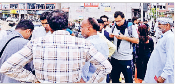
जींद। गैस सिलेंडर के लिए लाइन में लगे उपभोक्ता।